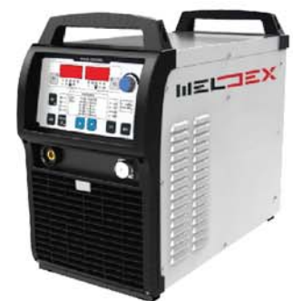
AMIG-350LST-R Low Spatter Type