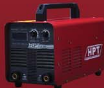
ST-168 ST-200 ST-303 TS-302