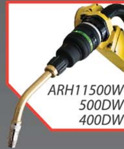
ARH11500W 500DW 400DW