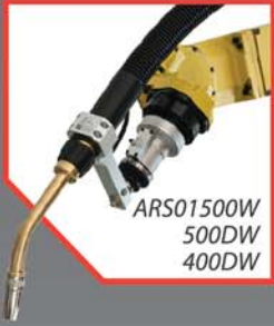
ARS01500W 500DW 400DW