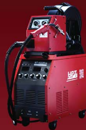
MT-400PRO MT-550PRO MT-650PRO